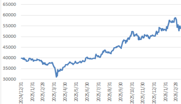
日經 225 指數