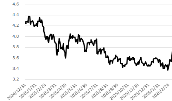
美國 2 年期公債殖利率