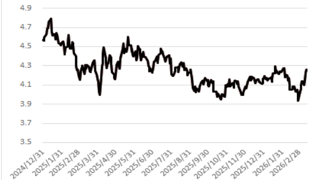
美國 10 年期公債殖利率