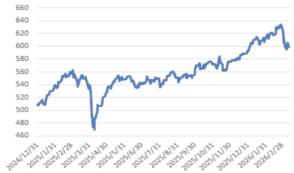
歐洲 600 指數